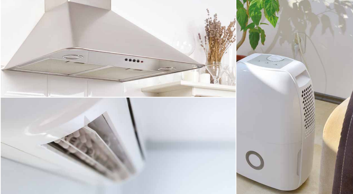
Possibili personalizzazioni: cappe da cucina, purificatori d'aria, sistemi di trattamento aria.